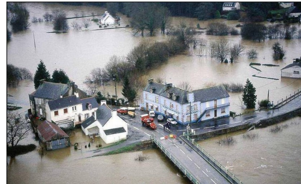
© Pont Augan 1995 – Ouest-France

Document réglementaire élaboré sous l'autorité du préfet de département, le plan de prévention des risques naturels vise à définir les zones exposées aux risques. Le PPRN ne constitue ni un programme d'aménagement, ni un programme de travaux. Il réglemente l'aménagement et l'usage du sol pour protéger les personnes, les biens et l'environnement. Il peut prescrire des travaux pour réduire l'exposition aux risques.